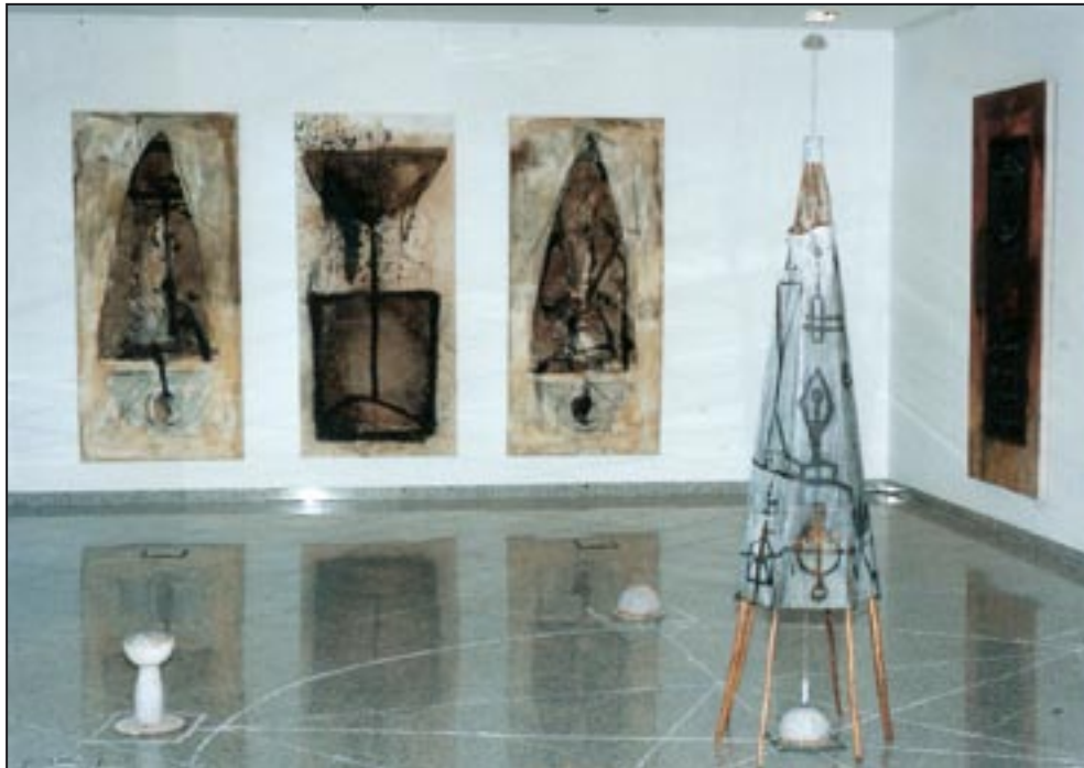
„Hylaea“ Galerie Müller, Leipzig