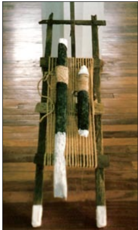
Die 1. Ausstellung in Brasilien fand 1994 im Museu de Arte Moderna do Acre Rio Branco statt. Sie wurde vom Goethe Institute Brasilia begleitet. „Regenwald und Brandrodung“