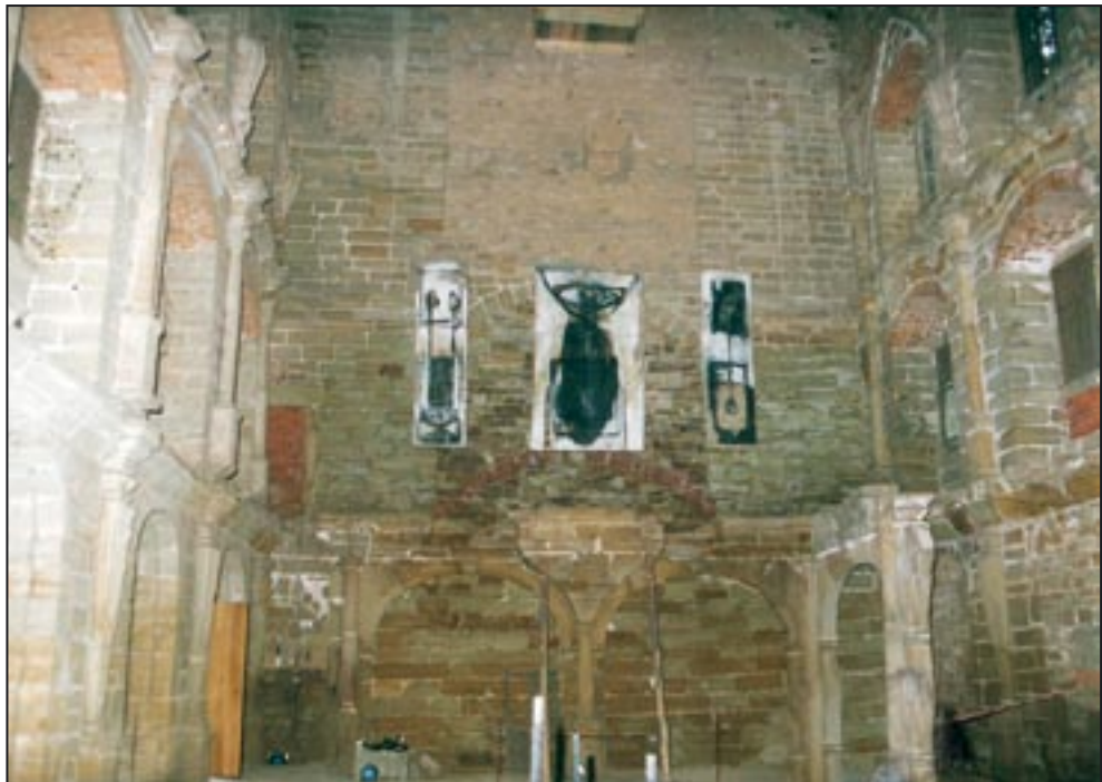
Exposição im castelo Droyßig 1999