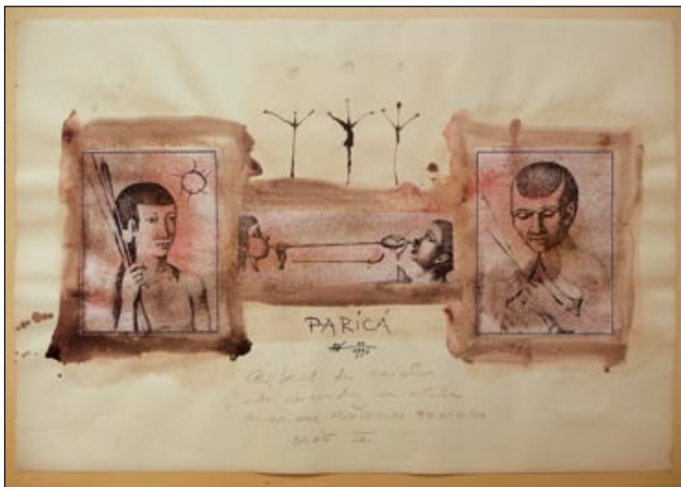
Paricá, Blatt IV 1993, Collage - Ink, 47 x 75 cm Gegenseitiges Einblasen von halluzinogenem Pulver. (Anadenanthera)