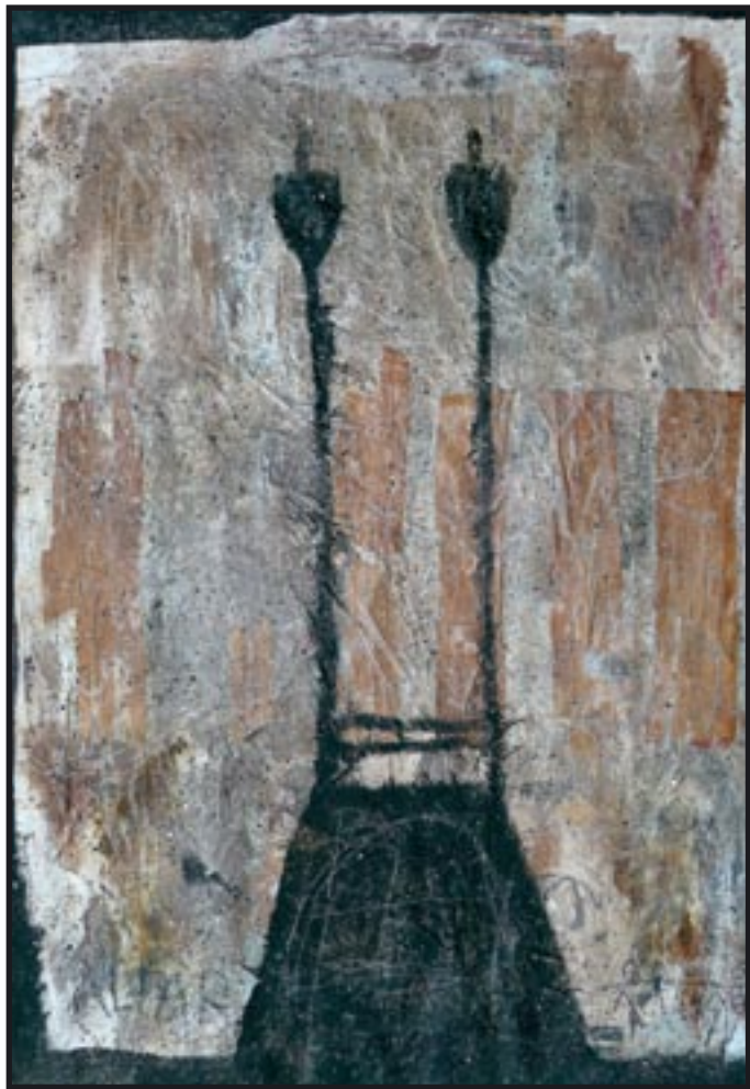
Altar III 1999, Dispersion auf Bananenblättern, 104 x 75 cm