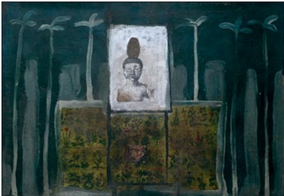
Jaguar 1995, Collage - Dispersion, 75 x 103 cm