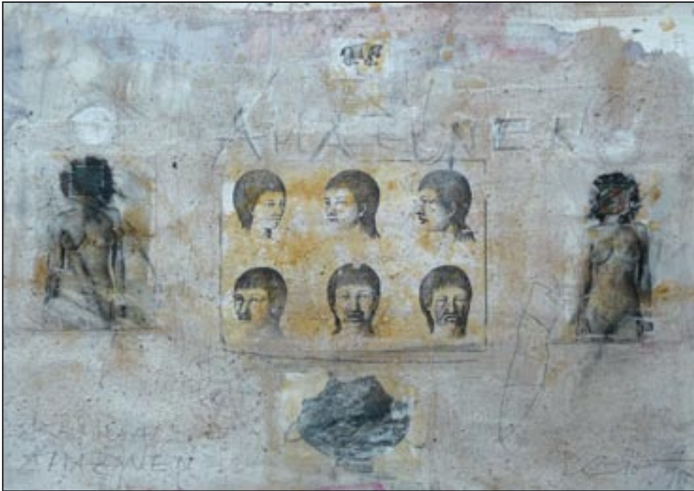
Amazonen 1994, Collage - Dispersion, 51 x 73 cm