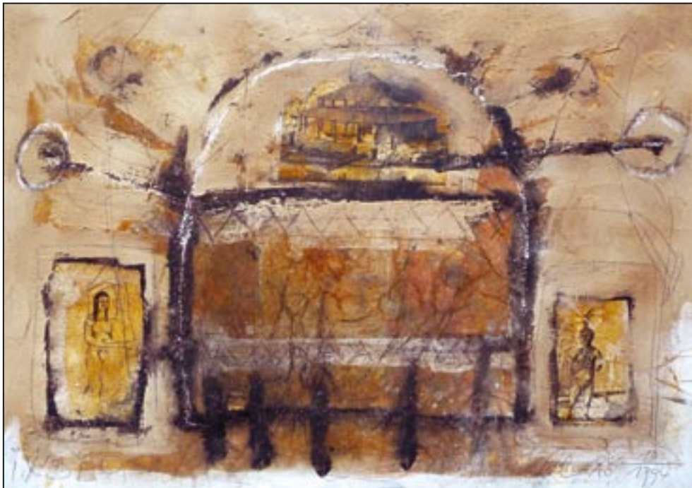
Rundling Rotonde casa 1994, Collage - Dispersion, 52 x 75 cm