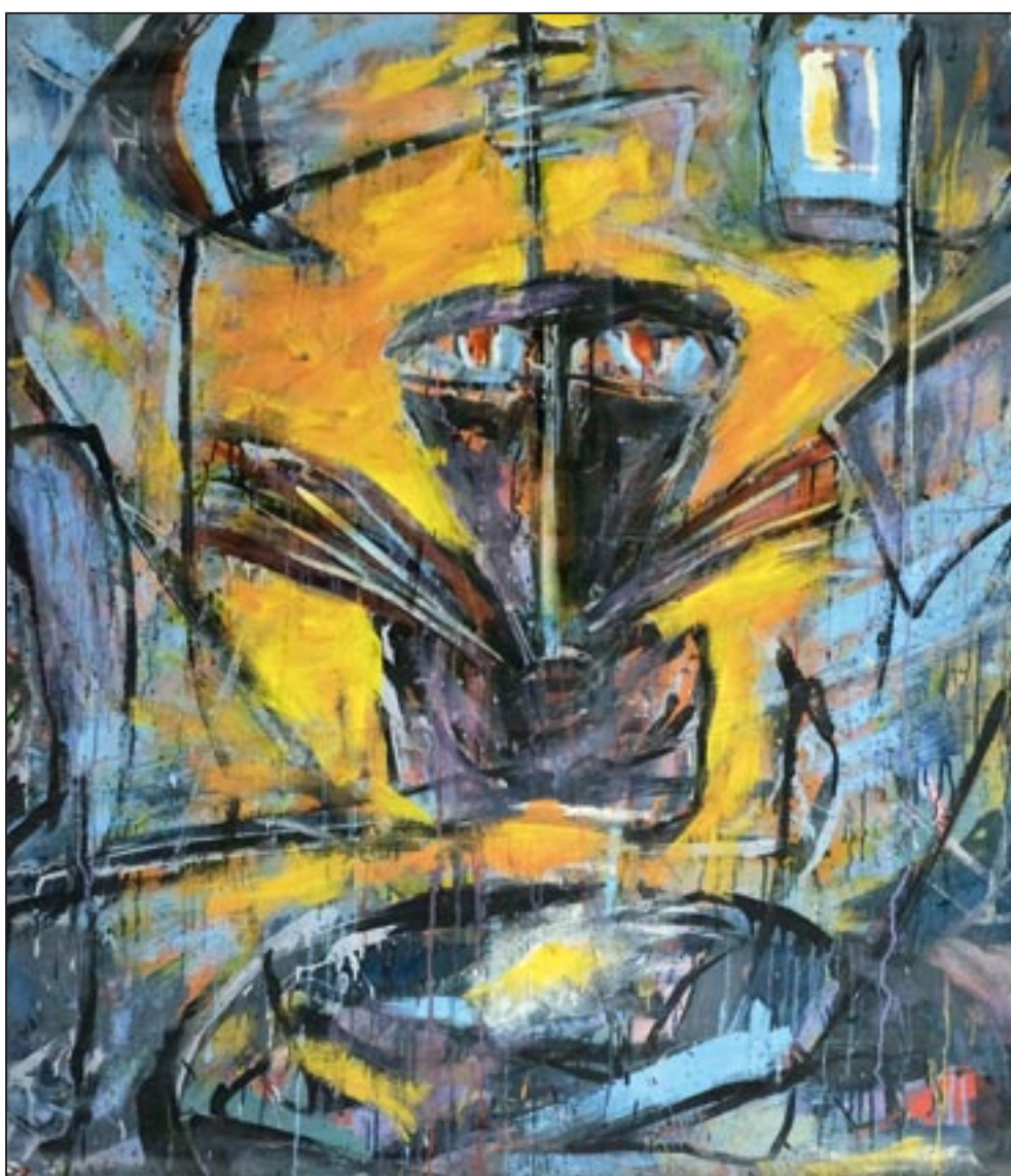
Lichtleib corpo de Luz 1995, Dispersion, 150 x 145 cm