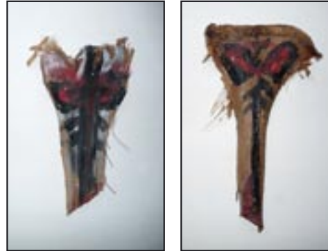
Masken aus Palmenwedeln 1993