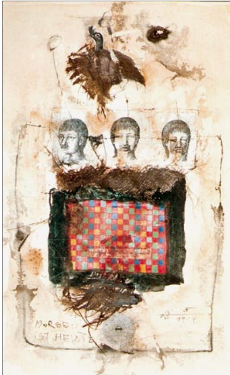
Morgen ist Heute 1994, Collage - Ink, 80 x 50 cm