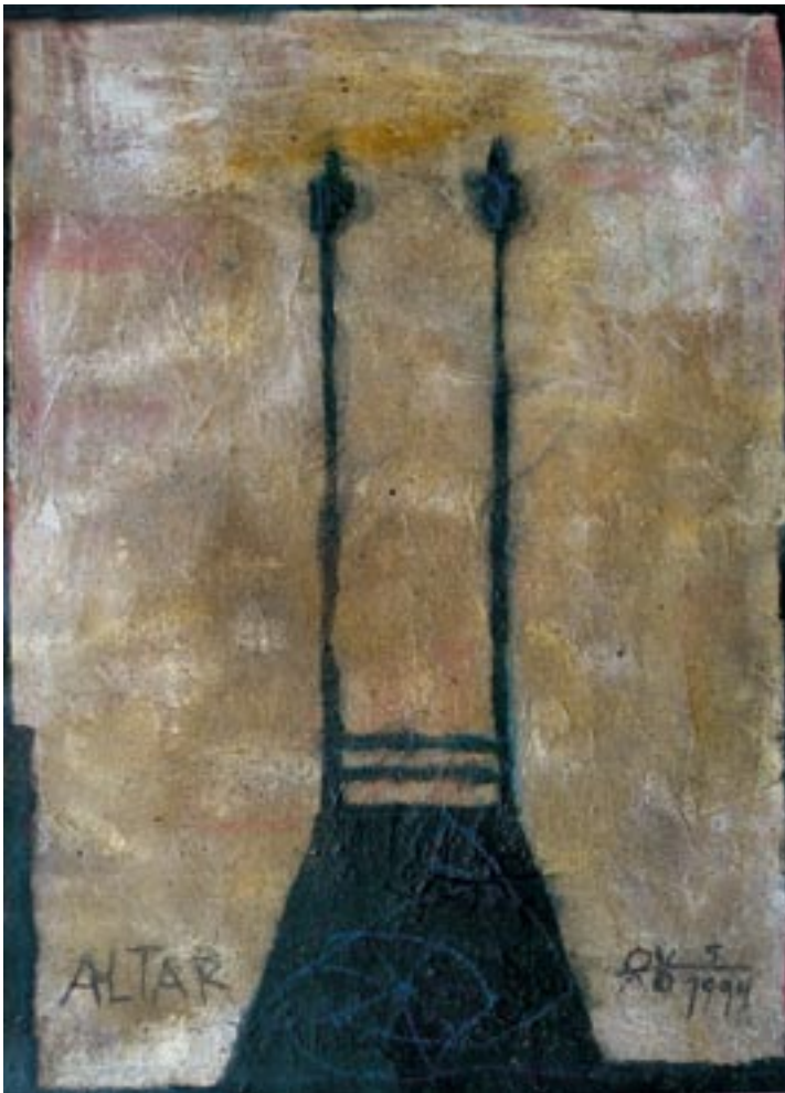
Altar II 1999, Dispersion auf Bananenblättern, 104 x 75 cm