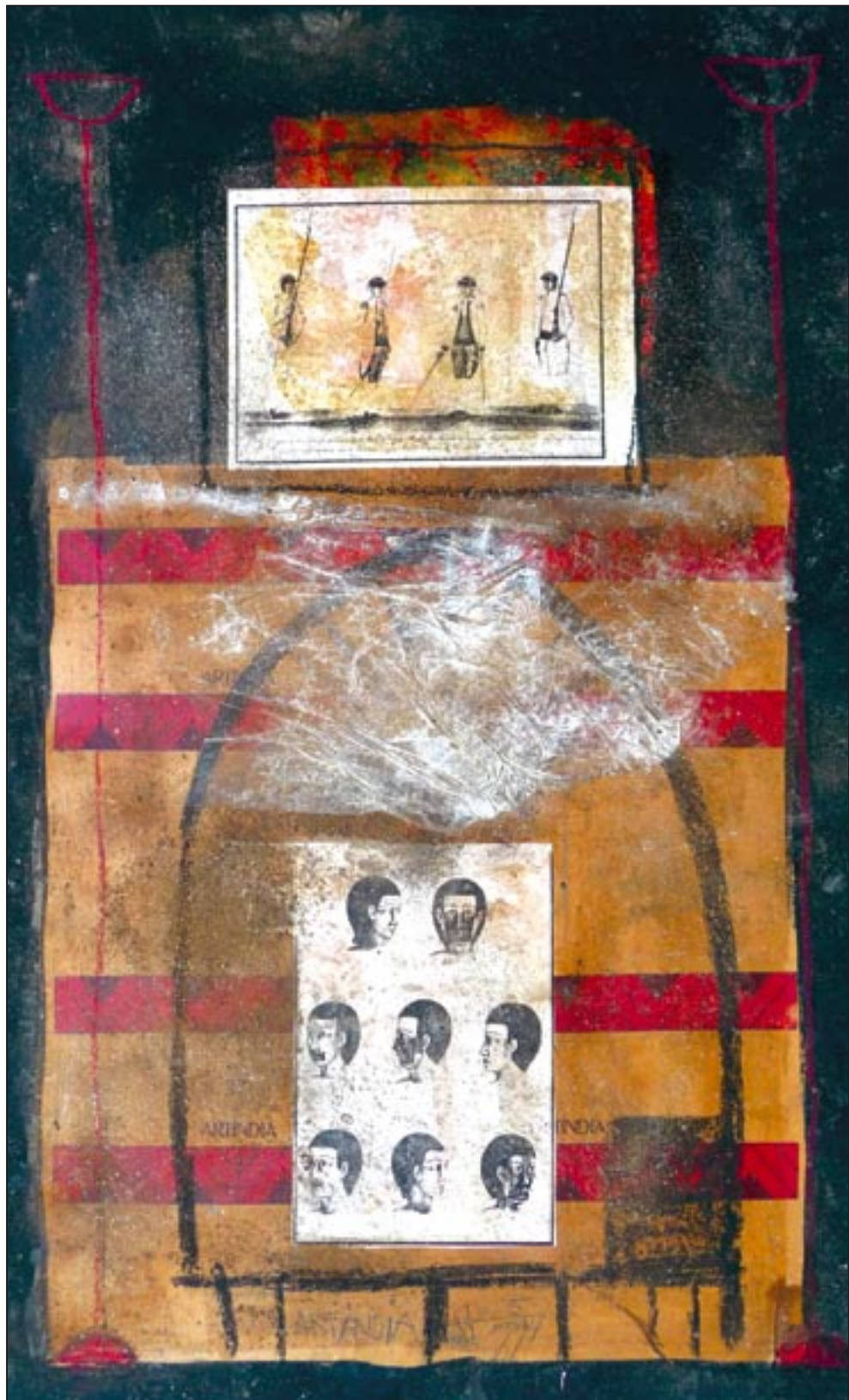
Art India 1999, Collage - Dispersion, 108 x 75 cm