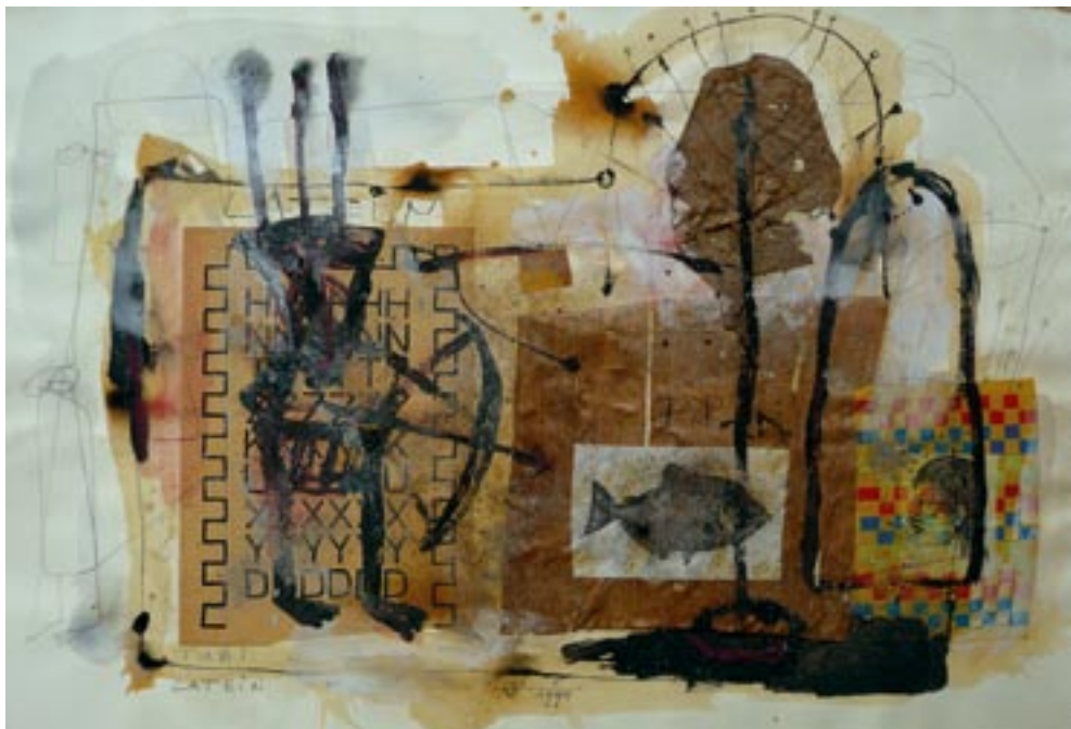
Tubi 1994, Collage - Dispersion, 52 x 75 cm