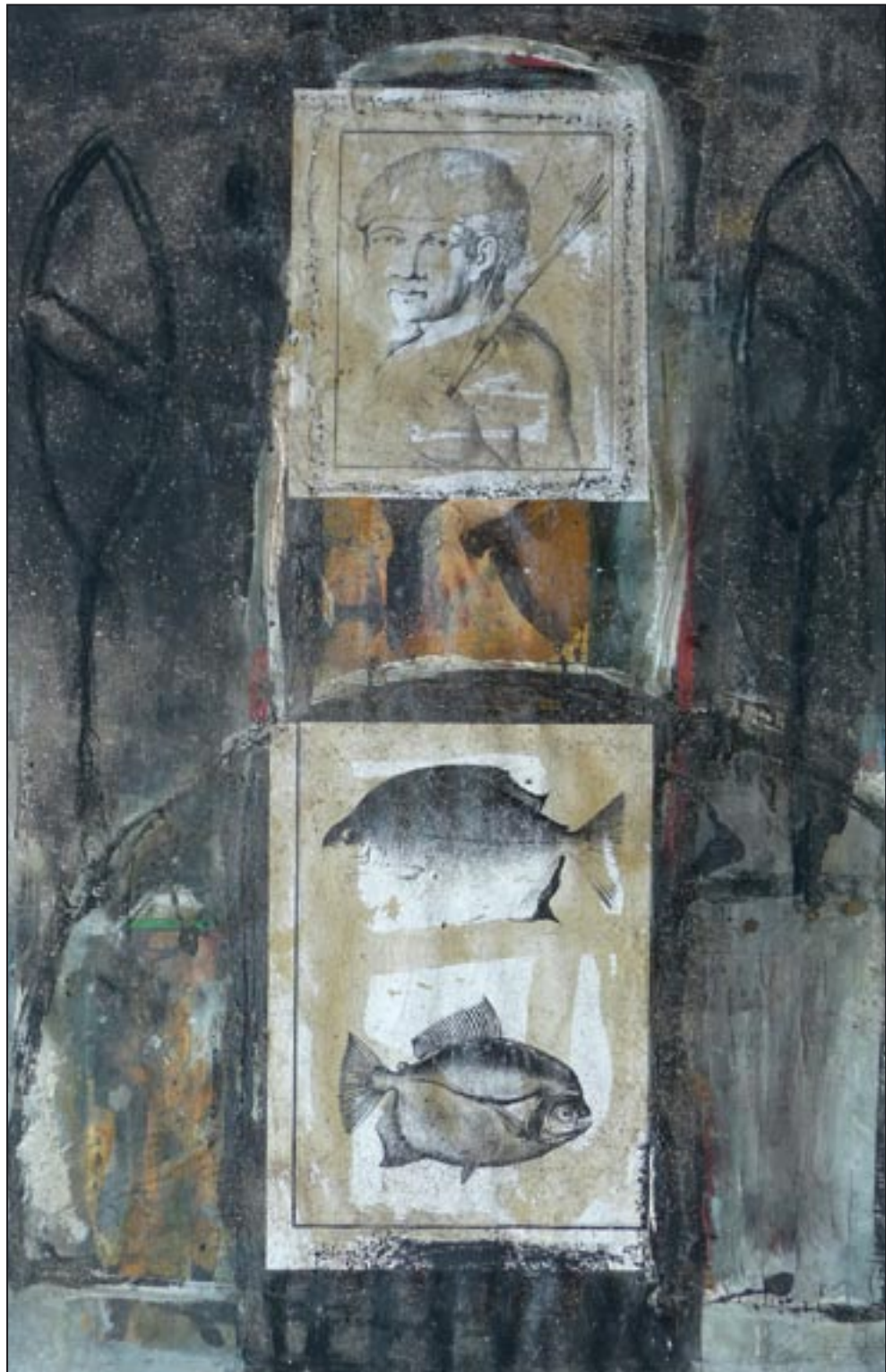
Piranhas 1994, Collage - Dispersion, 80 x 60 cm