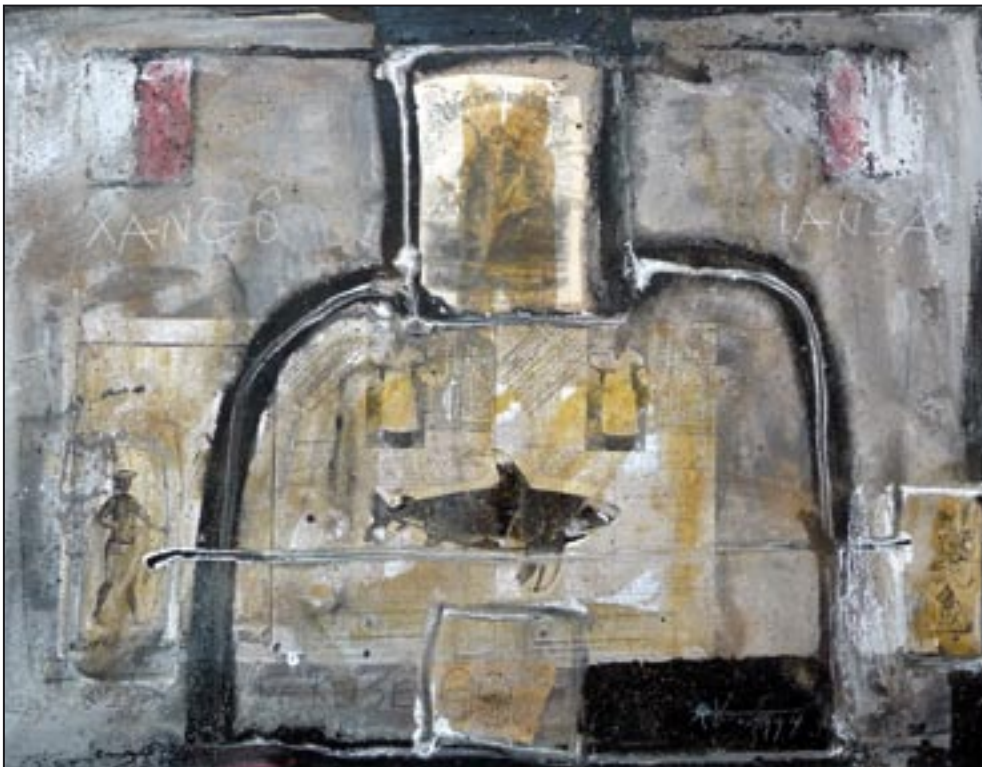
Die Reise der Götter ORIXAS 1994, Collage - Dispersion, 75 x 105 cm

Die Orixas (Òrìṣà) sind die Götter in der Religion der Yoruba. Xango - Blitz und Donner, weiß + rot Iansa, seine Frau, Wind und Sturm, rot + weiß Diese Götter gehören unter anderen zu den Doppelgottheiten im Candomblé und Umbanda.