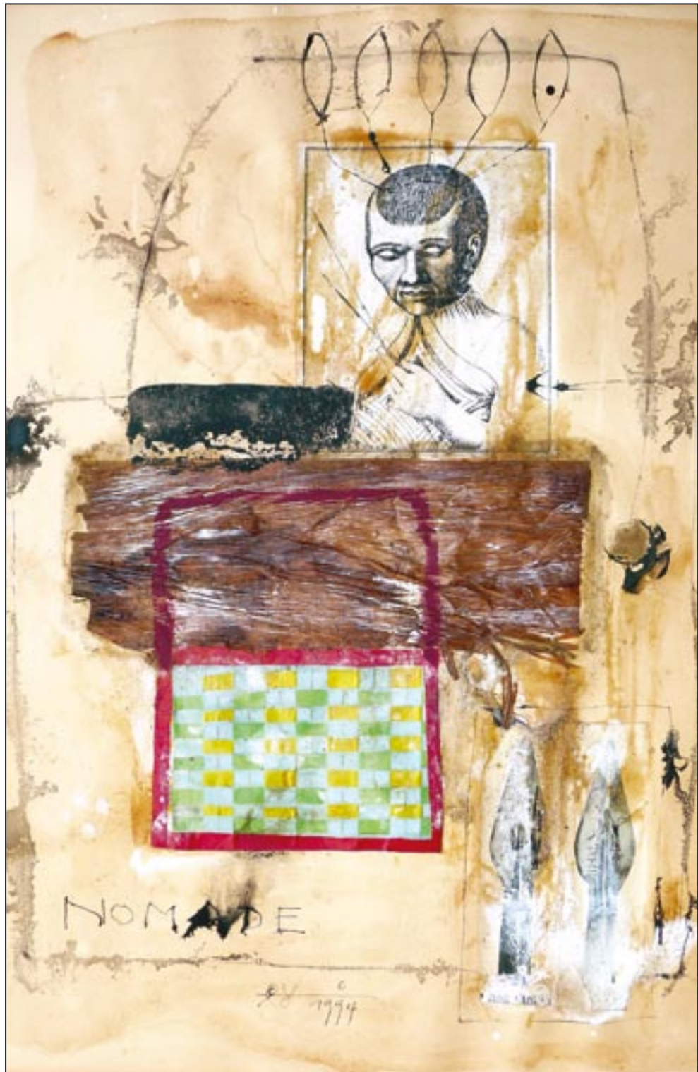
Asháninka 1994, Collage - Ink, 70 x 50 cm (Idigenes Volk der Arawak im östlichen Peru und westlichen Brasilien)