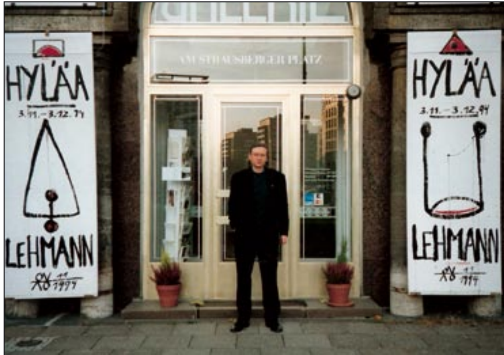
„Hyläa“ Galerie am Strausberger Platz, Berlin