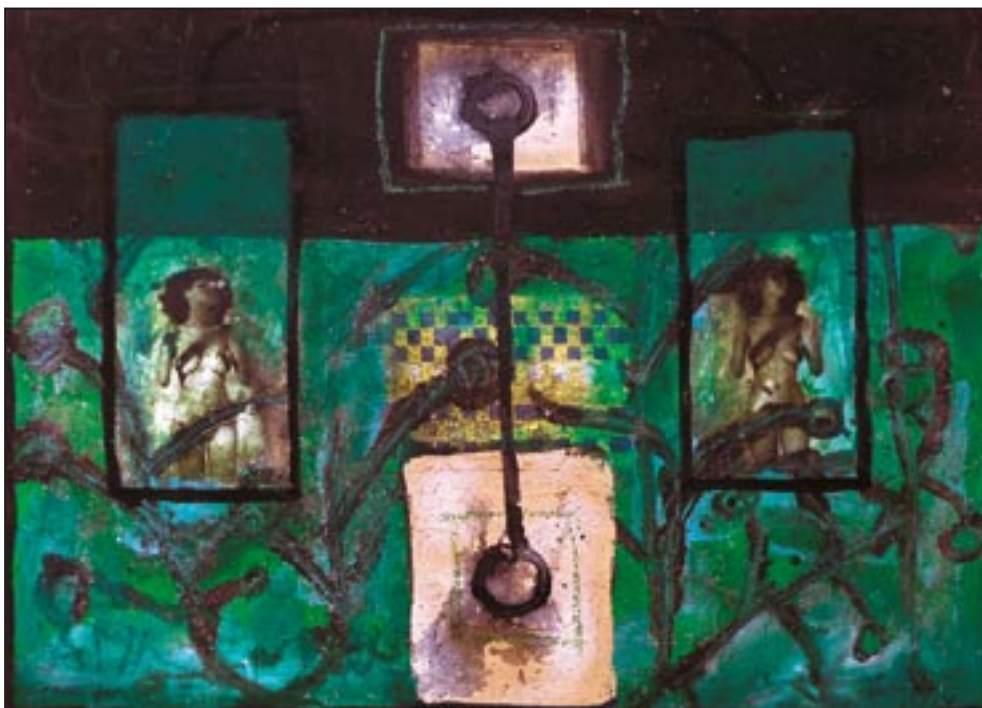
Amazonen verde 1994, Collage - Dispersion, 54 x 75 cm