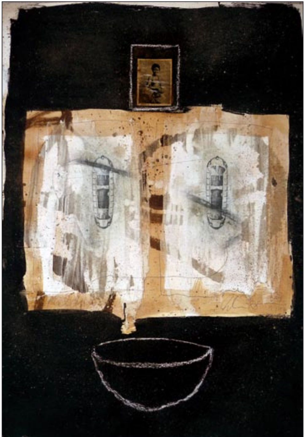
Kelch - calyx 1994, Collage - Dispersion, 109 x 75 cm