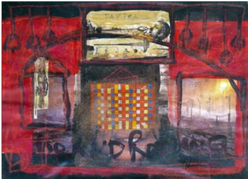
Aipe 1994, Collage - Dispersion, 53 x 75 cm Ein Halluzinogen der Sateré-Mawé Indios.