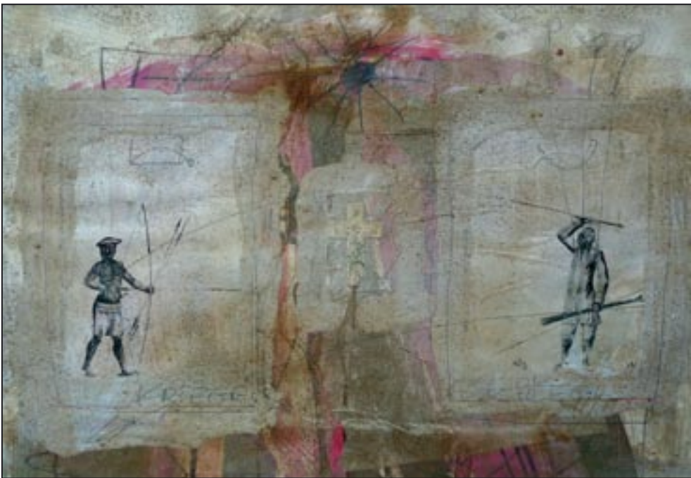
Krieger lutador 1994, Collage - Dispersion, 52 x 75 cm