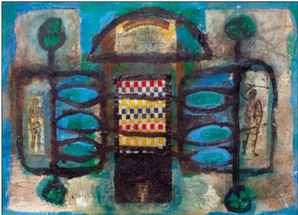
Macumba 1994, Collage - Dispersion, 52 x 75 cm