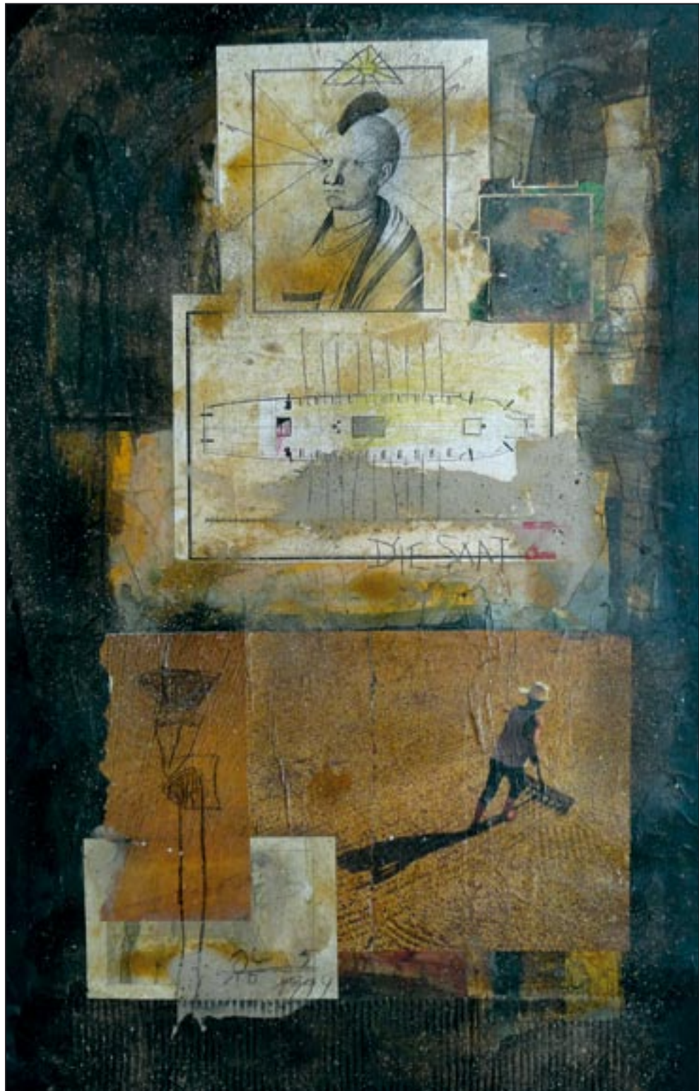
Die Saat semeadura 1999, Collage - Dispersion, 99 x 60 cm