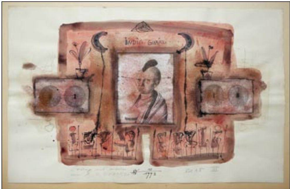
Indio de Guaraní, Blatt III 1993, Collage - Ink, 47 x 75 cm