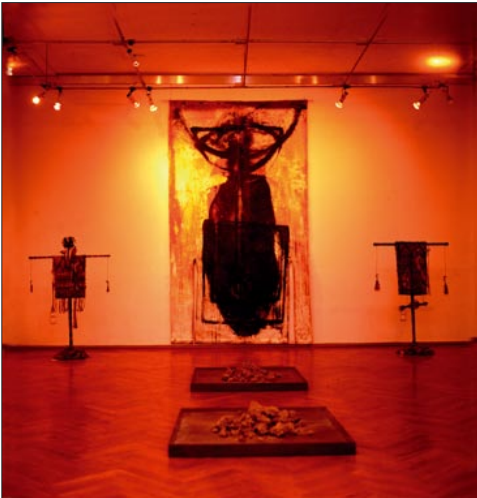
„Hylaea“ Galerie am Strausberger Platz, Berlin