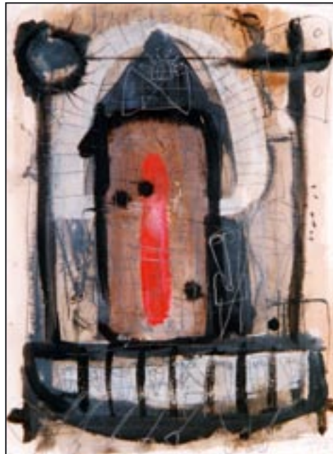
Hausboot - Casa-barco 1993, Dispersion

Study at the Akademie of „Graphic and Book Art“ in Leipzig Awarded Diploma in Painting, Freelance Artist Grant of the Art Foundation F.E.I.E., Paris, France Grant from ARCI, Trento, Italy Premio Italia Art Prize Grant from HorizontEuropa, Trento, Italy Grant from Atelierhaus Worpswede, Worpswede, Germany Grant for Rio Branco, Brazil Galleere Dreiskau-Muckern, Germany Alois Senefelder Prize, Warsaw, Poland Symbol Sower Akreanish Totems Numenschreine Gilgamesch Guard