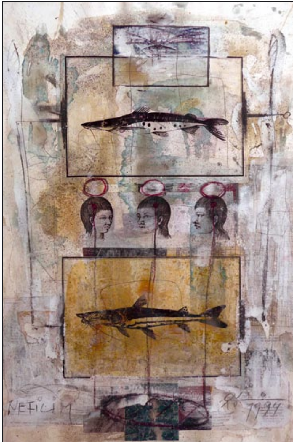
Nefilim 1994, Collage - Dispersion, 75 x 55 cm