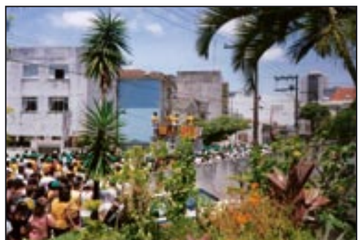
Carneval in Salvador