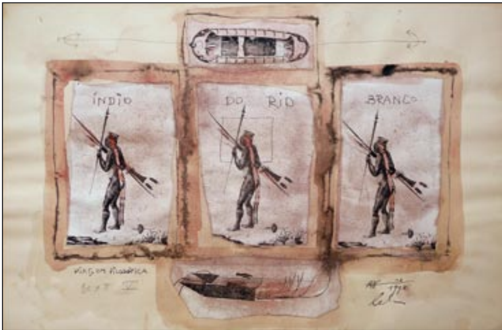
Indio de Rio Branco, Blatt V 1993, Collage - Ink, 47 x 75 cm