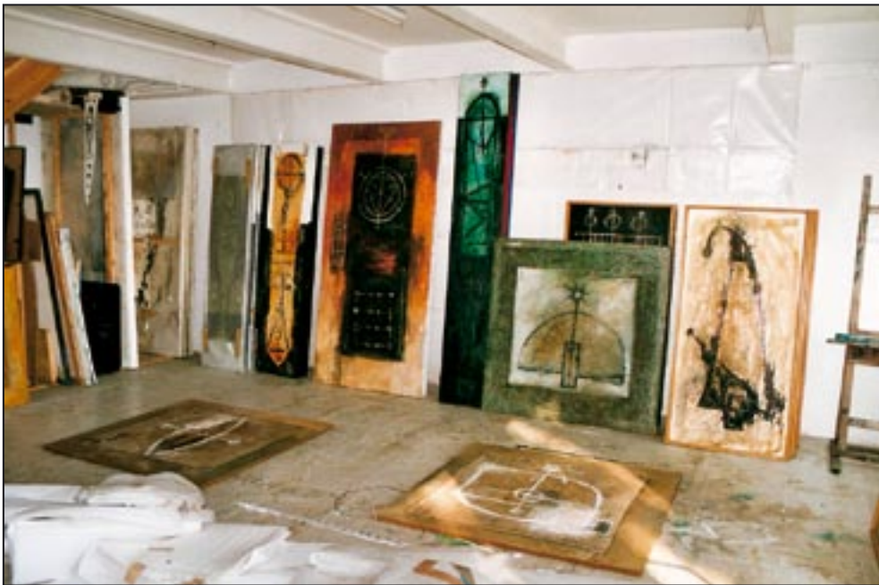
Atelier in Dreiskau-Muckern ab 1995 Hier entstanden die letzten Arbeiten zum AMAZONAS-Projekt.