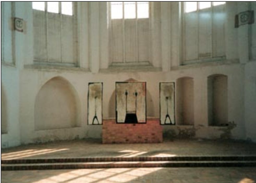
Exposição chapel ALTAR 1997