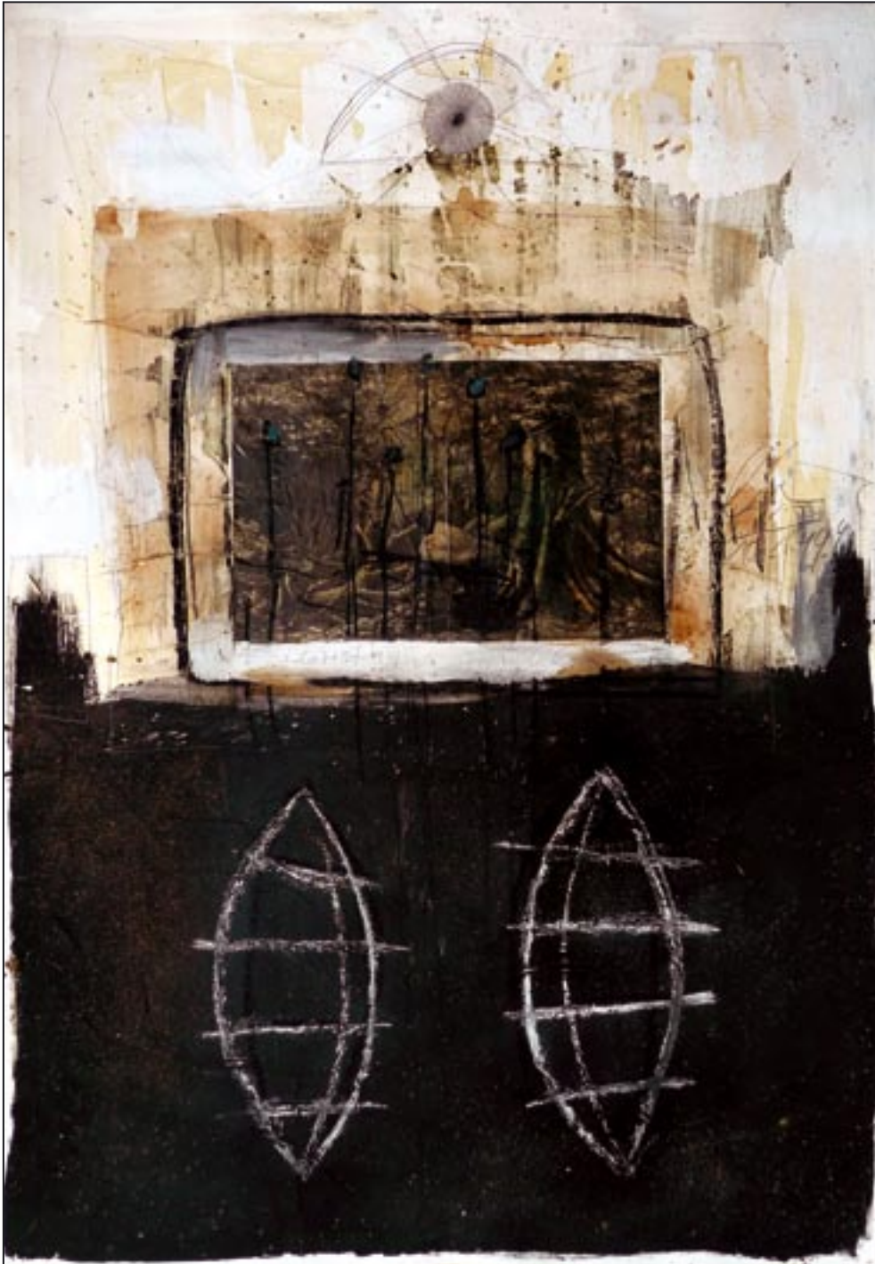
Floresta 1994, Collage - Dispersion, 109 x 75 cm