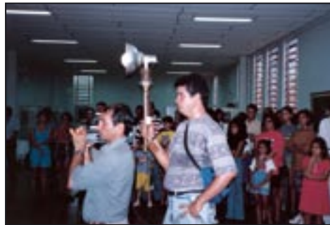
Vernissage im Museu de Arte Moderna in Rio Branco 1994

Architektur, Landschaften, Pflanzen, Tiere, Menschen, Werkzeuge und vieles andere mehr. Ihm kam es dabei auf Detailtreue, Sachlichkeit, ja, auf Genauigkeit der Schilderung schlechthin an; was er dokumentieren ließ, konnte nicht mehr verschwinden oder getilgt werden, wenigstens nicht als Bild.