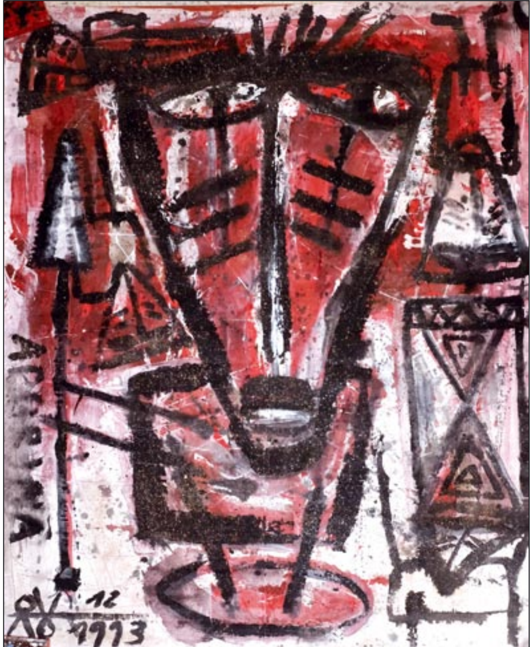
Kaxinawa 1993, Dispersion, 170 x 140 cm Die Caxinauás leben im nordöstlichen Peru und in Brasilien.