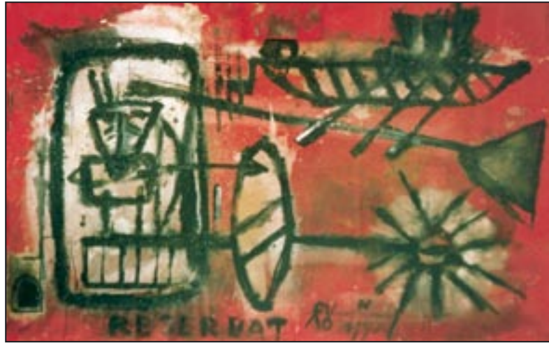
Reservat 1993, Dispersion, 140 x 180 cm