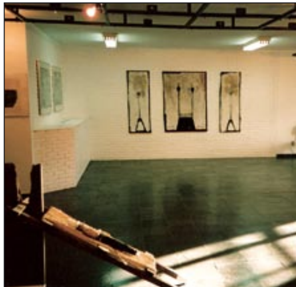
Goethe-Institute Brasilia 1994