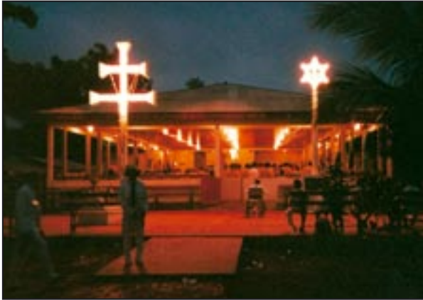
Der Alto Santo mit dem Grab von Irineu

Aufzeichnungen aus meinem Skizzenbuch nach dem ersten Besuch der Santo Daime. Do meu sketchbook. S.27