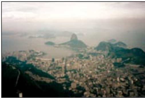
Start der Reise in Rio de Janeiro