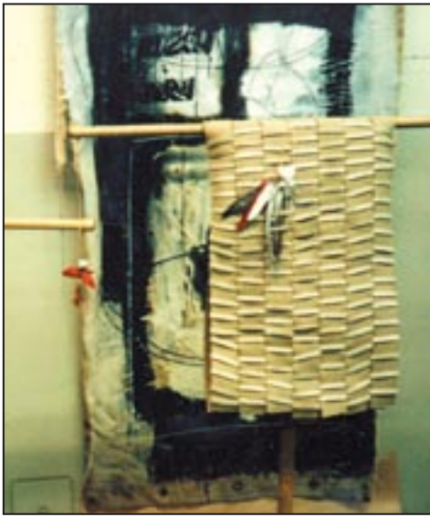
Atelier im „Elsterpark“, Leipzig