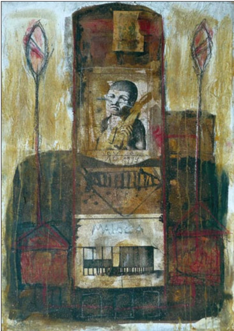
Maloca 1994, Collage - Dispersion, 84 x 60 cm Langhaus für Versammlungen und Tänze.