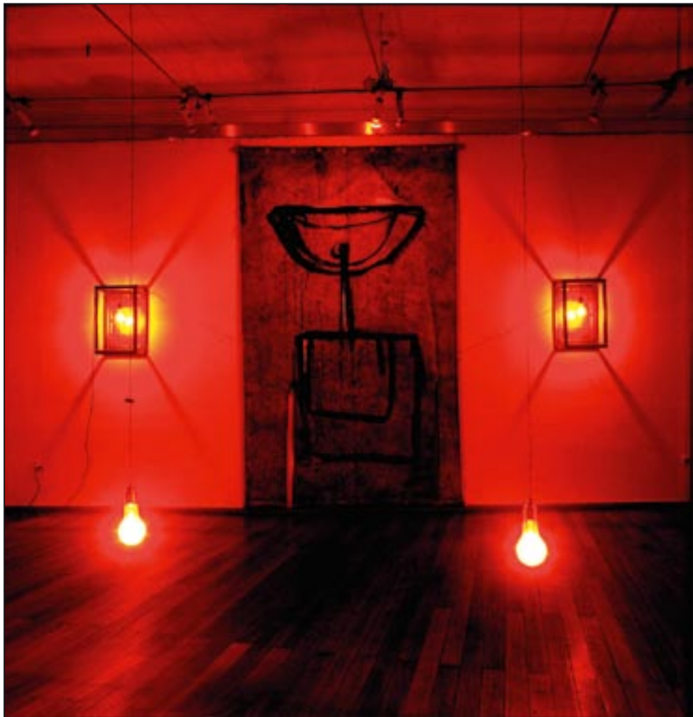
„Amazonien“ Galerie am Domhof, Zwickau