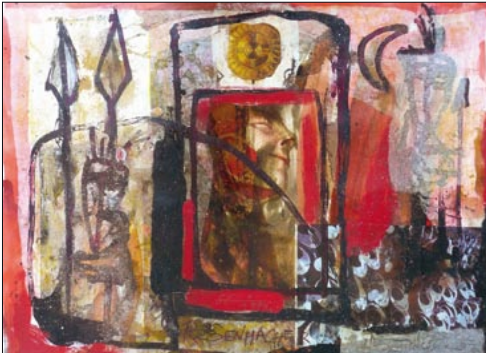
Regenmacher - Rainmaker 1994, Collage - Dispersion, 53 x 75 cm