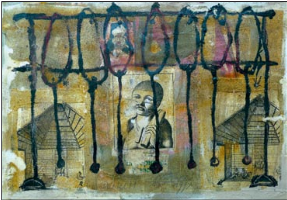
Donum 1994, Collage - Dispersion, 52 x 75 cm