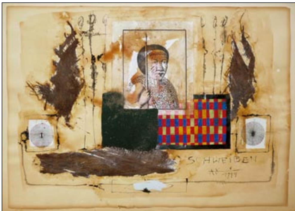
Das Schweigen der Jurupixuna 1994, Collage - Ink, 50 x 70 cm