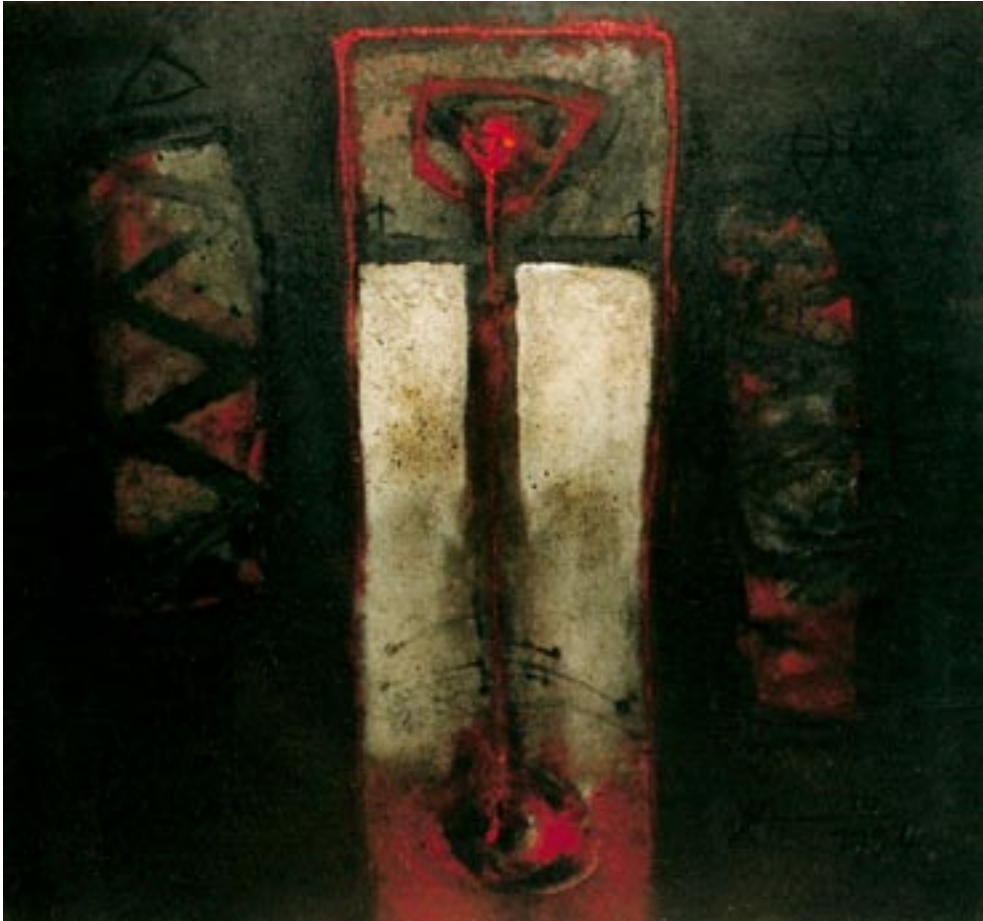
Orakel 1994, Oel auf Leinwand 120 x 130 cm