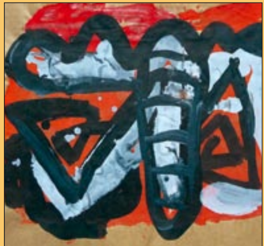
12 Skizzen esboços 1993, Dispersion