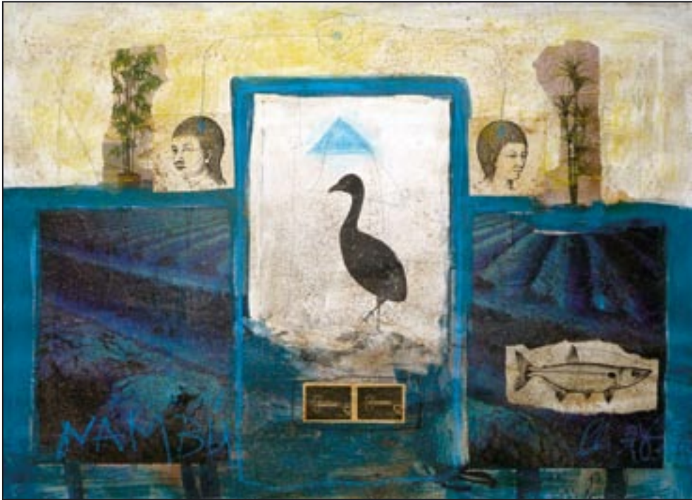
Nambu 1994, Collage - Dispersion, 53 x 75 cm Brasilianischer Laufvogel